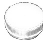
Verschluss mit Sicherungsring innen (B)