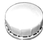
Verschluss mit Sicherungsring außen (T)