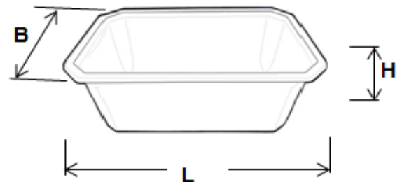
Schale 3.500 ml